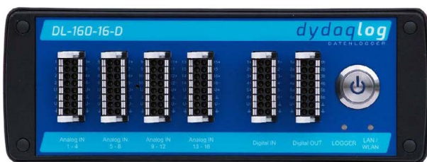
dydaqlog mit 16 analogen Eingängen, digitalen I/O und leistungsfähigem ARM® Prozessor

Jeder dydaqlog Datenlogger ist gleichzeitig ein leistungsfähiger Webserver. Alle Funktionen sind über die moderne Weboberfläche in einem Browser einzurichten und zu verwalten. Messdaten können komfortabel on- oder offline dargestellt werden.